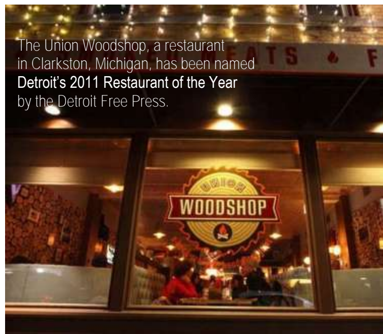
The Union Woodshop, a restaurant in Clarkston, Michigan, has been named Detroit's 2011 Restaurant of the Year by the Detroit Free Press.