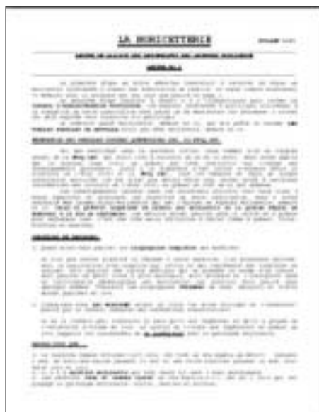
Bulletins 1 à 12

Le montage ci-dessous vous présente l'évolution de notre bulletin depuis sa première parution en janvier 1995. Nous espérons que vous apprécierez la prochaine formule que vous ne recevrez qu'au début de mars 2004 .