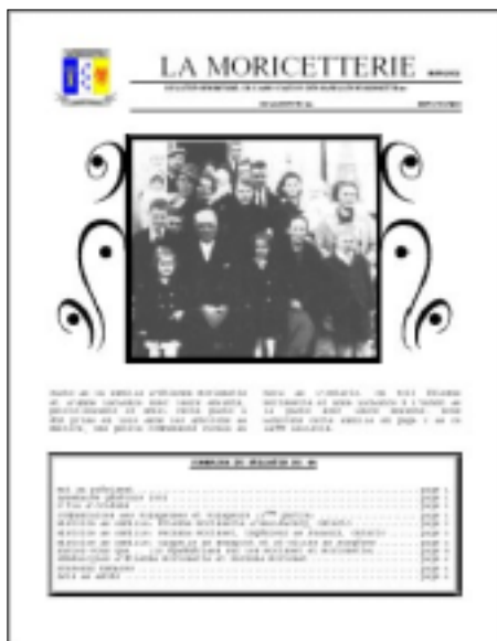
Bulletins 19 à 54