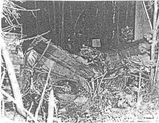
Les restes du DC-3 écrasé à Sault-au-Cochon