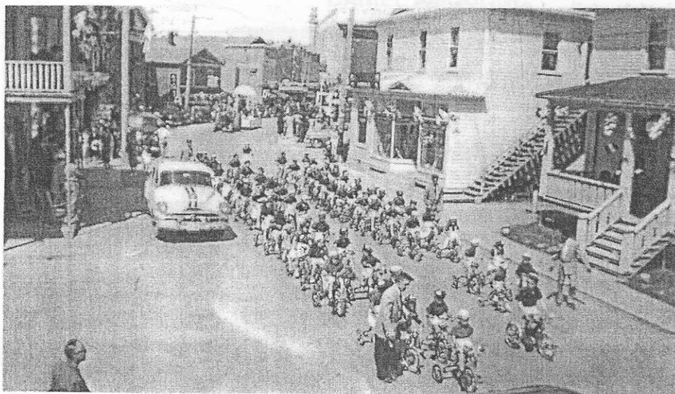
Défilé de la Saint-Jean-Baptiste - Amqui, 1950