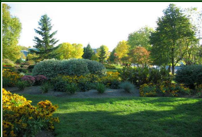
Parc botanique   fleur d'eau (Rouyn-Noranda)